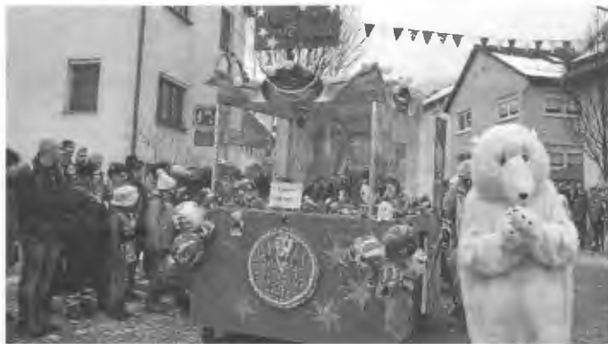
Begeisterte Groß und Klein: der „Gosbacher Rummel“ 2015

Auch in diesem Jahr veranstaltet die Faschingsgesellschaft wieder den traditionellen Umzug am Fasnetssonntag, den 26.02.2017. Der bunte Gaudiwurm zeichnet sich durch die zahlreichen privaten Laufgruppen aus. Diese prägen den Umzug und tragen maßgeblich dazu bei, dass die Zuschauer am Straßenrand Spaß an der Fasnet haben.