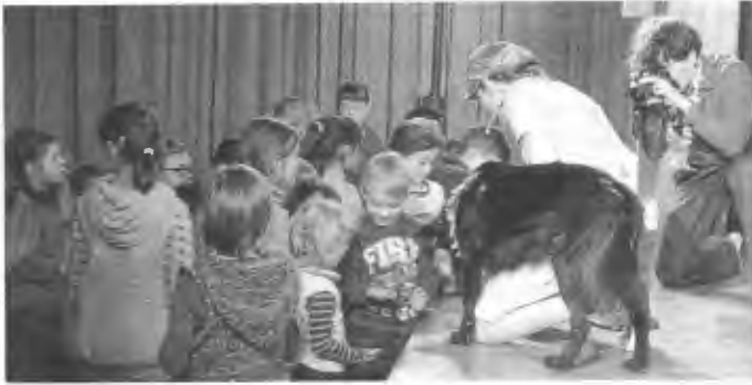
Zum Schluss durften die Jungen und Mädchen sogar Charlie streicheln und Leckerlis füttern