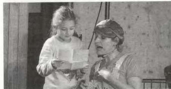
Die anwesenden Kinder wurden immer wieder zum Mitmachen animiert

Rund 80 Kinder sind unserer Einladung ins Bürgerhaus gefolgt und durften eine witzige und spannende Geschichte erleben. Alle waren begeistert und werden den Kim und den Hund Charlie nicht so schnell vergessen.