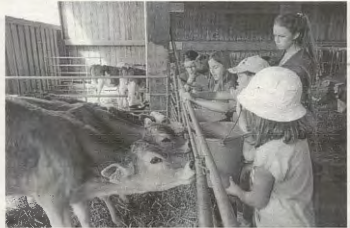
Das Füttern und Streicheln war eine wahre Freude für die Kinder.