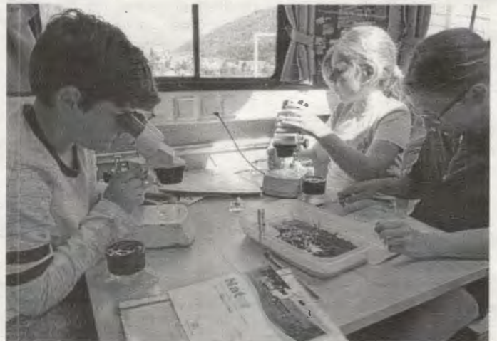
Tierbestimmung im Ökomobil

Ein besonderes Naturerlebnis folgte am Montag für die Kinder der Klasse 4. Sie lernten einige Kleinstlebewesen in der Fils kennen, indem sie diese zuerst artgerecht in Wasserbehältern entnahmen und dann unter dem Mikroskop untersuchten.