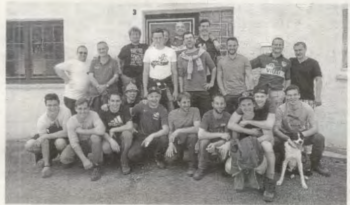
Eine gut gelaunte Wandergruppe vor dem Gasthaus Alpenrose

Zu der alljährlichen Vatertagswanderung trafen sich 24 Unentwegte, um sich mal auf eine neue Route zu begeben. Das Ziel blieb mit der Loidiga Ranch auf der Albhochfläche zwar gleich, doch dieses Mal entschloss sich die Truppe, nicht wie sonst über Ditzenbach, sondern über den Esel und Oberdrackenstein dorthin zu gelangen. Doch schon in Gosbachs Ortsmitte trennte sich die Gruppe für eine gute Stunde in zwei Teile. Die eine entschloss sich über die Eselsteige auf die Hochfläche zu gelangen, die andere wollte unter der Autobahn durch die Dole gehen. Doch da diese unter Wasser und darüberhinaus versperrt ist, trat man eine Hardcore-Tour unter dem Autobahnviadukt den direkten Weg nach oben an. Spätestens hier sah man sich die Spreu vom Weizen trennen, sprich unfit von fit. Doch irgendwann waren alle wohlbehalten oben angekommen und nach kurzer Gehzeit konnte endlich eine wohlverdiente Erfrischung im Gasthaus Alpenrose auf den Eselhöfen zu sich genommen werden.