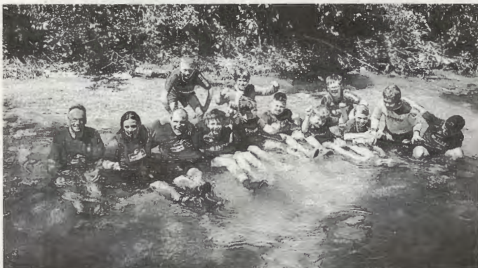
Die Meisterschaftsfeier beinhaltete natürlich wieder das obligatorische Bad in der Fils.