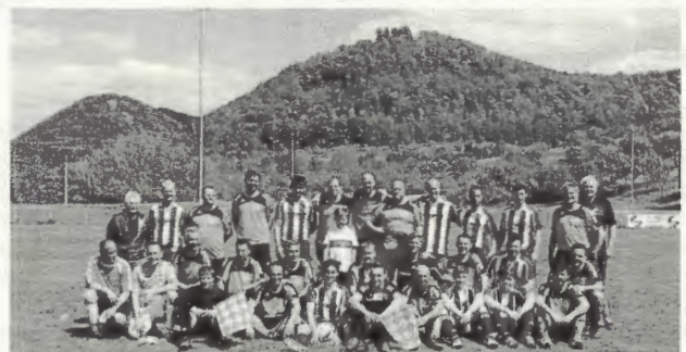
Ein schönes Bild: die FTSV-Fußballfamilie nach dem Spiel vereint!