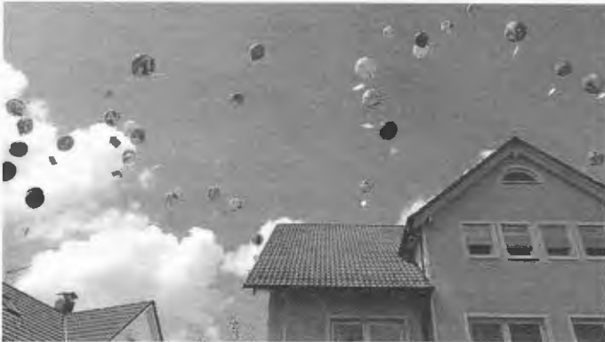
ca. 120 Ballons gingen an den Start.

8 Karten wurden an uns zurückgeschickt. Folgend die Gewinnerliste: