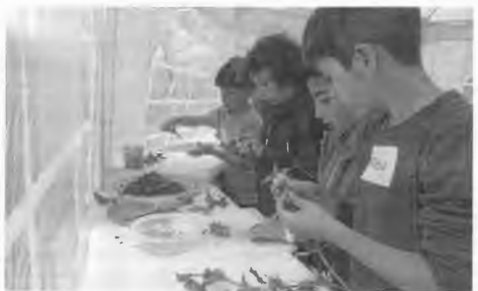
Hier wird gerade die Knoblauchrauke abgezupft.