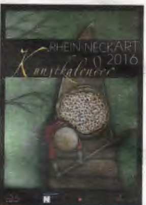
Titelseiten der Kunstkalender aus den Jahren 2012, 2014 und 2016