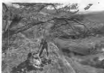
Erdgeschichte erleben ist das Motto der „Woche der Europäischen Geoparks“

Vom 14. bis 29. Mai dreht sich auf der Schwäbischen Alb alles um das Thema Geologie und Erdgeschichte. Bereits zum zwölften Mal veranstaltet der UNESCO-Geopark Schwäbische Alb in diesem Jahr die Aktionstage zur „Woche der Europäischen Geoparks“, mit einem lehrreichen, spannenden und unterhaltsamen Programm rund um die bewegte Erdgeschichte der Schwäbischen Alb.