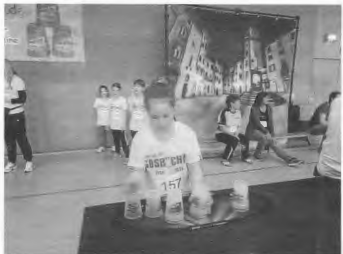
Die erfolgreiche Staffel 2014 bei der DM in Butzbach

Bitte einfach in der Schule abgeben oder in den Briefkasten werfen. Herzlichen Dank.