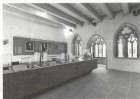
Franziskanermuseum - Kapitelsaal