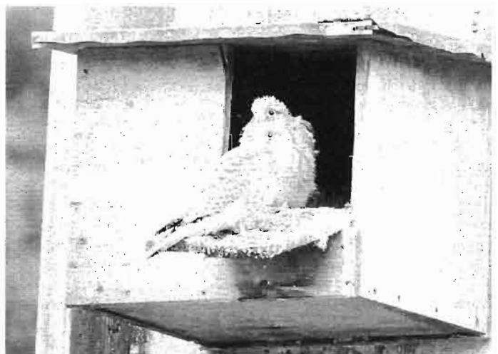
Auf dem Foto sieht man 2 flügge Falken, die noch etwas zögern

Die eifrigen Mäusejäger haben auch dieses Jahr wieder 7 Junge aufgezogen, übrigens schon das 3. Jahr, die sich jetzt auf ihr Leben außerhalb des Nistkastens vorbereiten.