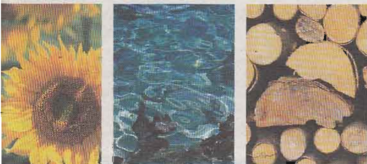
Illustration: Wilson / iStockphoto.com

Unterdorfstraße 58 · 73342 Bad Ditzgenbach-Gosbach Telefon (0 73 35) 92 08 50 · Telefax (0 73 35) 92 08 55 stadler-heizung@t-online.de · www.stadler-heizung.de