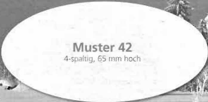
Muster 42 4-spaltig, 65 mm hoch

... wünschen wir Ihnen und allen unseren Freunden und Bekannten.