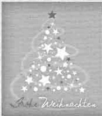
Muster 43 2-spaltig, 50 mm hoch

Am Ende des alten Jahres möchten wir uns bei unseren Kunden und Geschäftsfreunden für die gute Zusammenarbeit bedanken.