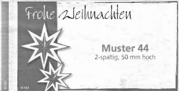
Muster 44 2-spaltig, 50 mm hoch