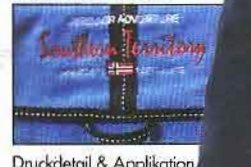
Druckdetail & Applikation