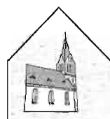
Kirchengemeinde St. Magnus - Gosbach