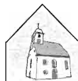
Kirchengemeinde St. Michael - Drackenstein

LEKTOR/-INNEN und KOMMUNIONHELFER/-INNEN: --