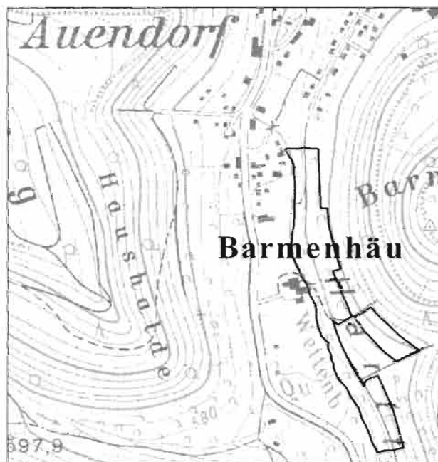
Auendorf - Barmenhäule