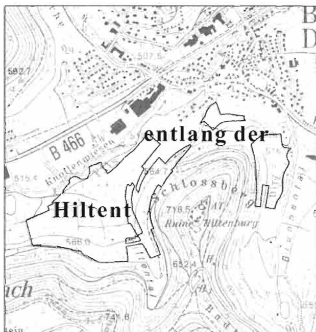
entlang der Ditz - Hiltental