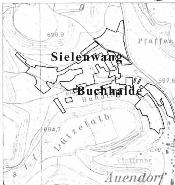
Sielenwang - Buchhalde

Die Bäume sollen so langfristig für Mensch und Natur erhalten werden. Dabei steht das Ziel, die Streuobstwiesen als wichtigen Lebensraum für seltene Vogelarten zu erhalten im Vordergrund. Für Streuobstwiesenbesitzer und -pächter ergeben sich daraus attraktive Unterstützungsmöglichkeiten bei der Pflege ihrer Obstbäume.