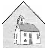
Kirchengemeinde St. Michael - Drackenstein

Kath. Kirchenpflege Gosbach, Kto.-Nr. 8 002 804, Kreissparkasse Göppingen (BLZ 610 500 00). Wir freuen uns über Ihre Spende!