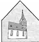
Kirchengemeinde St. Magnus - Gosbach

Spendenkonto Innenrenovierung St.-Laurentius-Kirche: Kath. Kirchenpflege Bad Ditzenbach, Kreissparkasse Göppingen, Kto.-Nr. 8 525 587 (BLZ 610 500 00). Wir freuen uns über Ihre Spende!