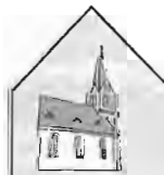
Kirchengemeinde St. Magnus - Gosbach