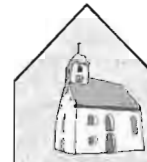
Kirchengemeinde St. Michael - Drackenstein

Kath. Kirchenpflege Gosbach, Kto.-Nr. 8 002 804, Kreissparkasse Göppingen (BLZ 610 500 00). Wir freuen uns über Ihre Spende!