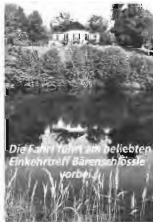
Die Fahrt führt am beliebtesten Einkehrtreff Bärenschlössle vorbei.

Wir fahren bei dieser Tour durch die stattlichen Wälder des Rot- und Schwarzwildparks, die innerhalb des Landschaftsschutzgebietes Glemswald liegen. Dabei kommen wir mit dem Bärenschlössle und dem Schloss Solitude an historisch interessanten Baulichkeiten vorbei. Besonders schön ist diese Tour sicher im Herbst, wenn die Blätter bunt sind, aber auch der Frühling mit seinem frischen Grün hat seinen Reiz, und im Sommer ist man dankbar für den Schatten, den die Bäume werfen.