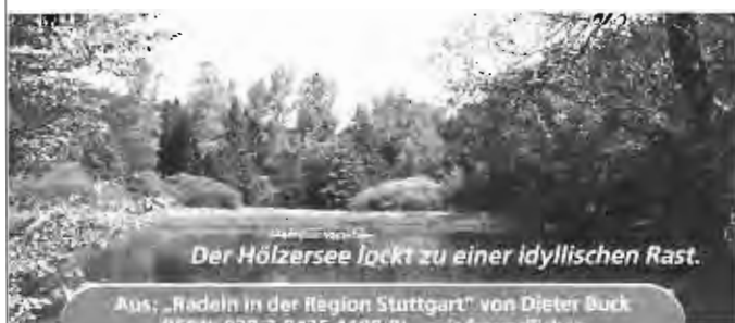
Der Hölzersee lockt zu einer idyllischen Rast.

Aus: „Radeln in der Region Stuttgart“ von Dieter Buck (ISBN: 978-3-8425-1108-8) – mit freundlicher Genehmigung des Silberburg-Verlags, Tübingen