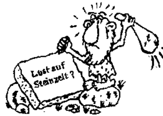
Eine Reise in die Steinzeit

Die Gemeindebücherei Deggingen beteiligt sich auch am Frederick-Tag.