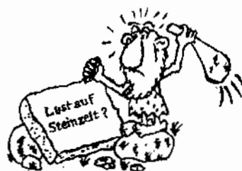
Eine Reise in die Steinzeit

Die Gemeindebücherei Deggingen beteiligt sich auch am Frederick-Tag.