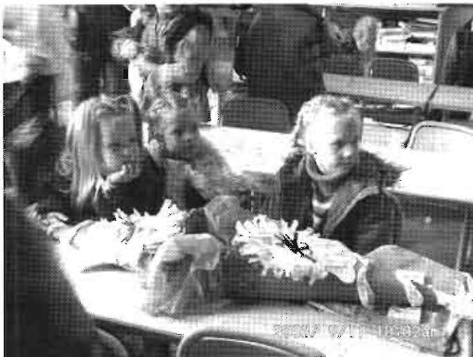
Gibt es heute schon Hausaufgaben?