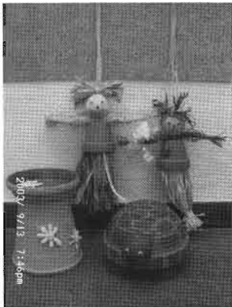
Diese Bastelarbeiten können Sie erwerben

Besuchen Sie unser Marktcafé am Mittwoch, dem 24. September 2003.