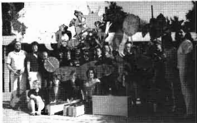
Die Akteure des "Schwarzen Theater" im Sonnenlicht

Auch die kleinen Zuschauer erkannten bei den phantastisch gelungenen Vorführungen die Botschaft zur Gewaltlosigkeit und hatten den Charakter des Frechen und Bösen aus dem immer wiederkehrenden Refrain bald entlarvt, denn "der blähte sich auf und zog weiter!"