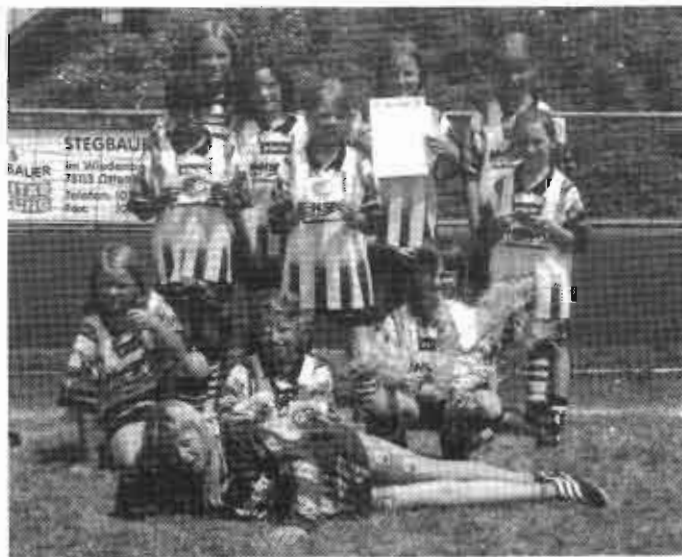
Unsere erfolgreiche Schulmannschaft

Die Vorrunde wurde im Mai für Buben und Mädchen in den Sportanlagen Gosbach ausgetragen.