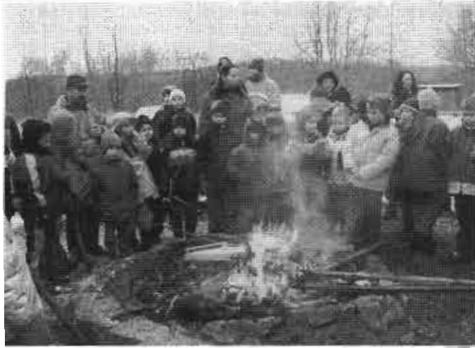
Waldweihnacht am letzten Schultag

Fast schon Tradition ist die alljährliche Winterwanderung von Schülern und Lehrerinnen der Grundschule Gosbach. Auf dem Aimer hielten die Elternbeiräte und begleitende Eltern Kinderpunsch und Gutsle am Lagerfeuer bereit. Für alle war dieser Wintertag ein schönes Erlebnis und die richtige Einstimmung auf die Weihnachtsferien.