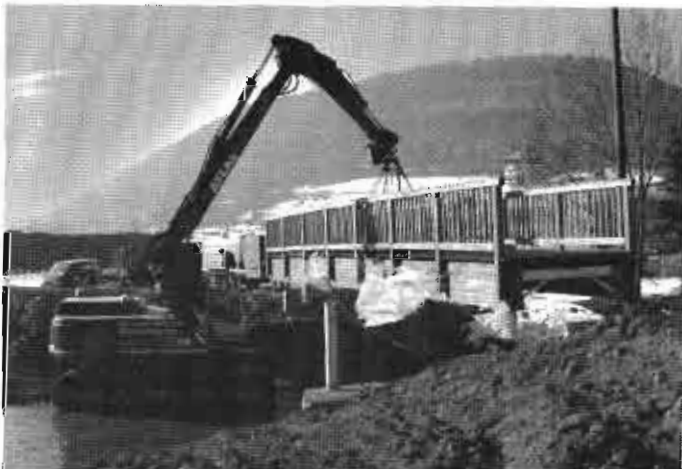
Montage der neuen Holzbrücke in Bad Ditzenbach

Durch die günstigen Witterungsverhältnisse in den vergangenen Wochen ist die mit den Tiefbauarbeiten beauftragte Bauunternehmung Kurt Gansloser GmbH aus Deggingen-Reichenbach i.T. gut vorangekommen. Der neue Uferweg entlang der Fils nimmt immer mehr Gestalt an. In der letzten Woche konnten die Fundamente für die beiden geplanten Brückenbauwerke über die Fils fertig gestellt und die von der Firma Schmees & Lühn, Holz- und Stahlingenieurbau GmbH aus Fresenburg angefertigten Brücken montiert werden.