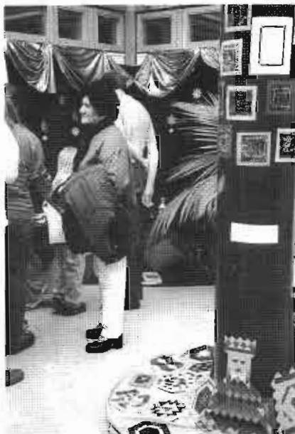
Im oberen Stock zauberten die Kinder des Gosbacher Kindergartens mit Teppichen, orientalischen Puppen, Edelsteinen und vielem mehr ein wahres orientalisches Paradies. Aber auch die Ostergeschichte wurde vom Katholischen Kindergarten aus Gosbach kunstvoll dargestellt.