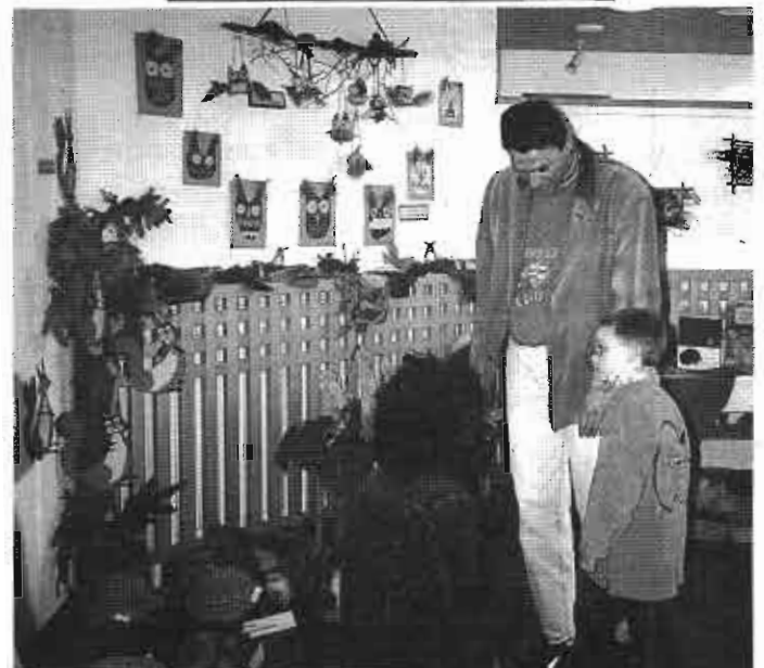
Die Ausstellung ist noch bis zu den Osterfeiertagen geöffnet.