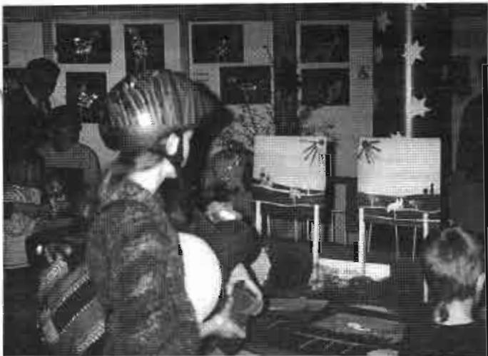
So wurden die Besucher vom Ditzzenbacher Kindergarten ins Land der Märchen entführt, wo sie u.a. Frau Holle, Aschenputtel oder die sieben Raben zu sehen bekamen.