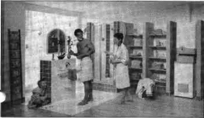
Ob Gas-Durchlauferhitzer oder Warmwasserspeicher – beide Varianten bieten modernste Warmwasserbereitung bei niedrigen Energiekosten. (wwp) Foto: Junkers/Bosch