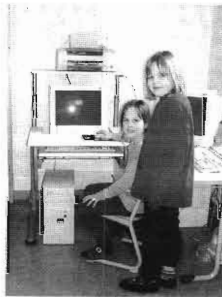
So macht das Internet erst richtig Spaß!

Ein tolles Geschenk der Fa. Moll System- und Funktionsmöbel GmbH Gruibingen