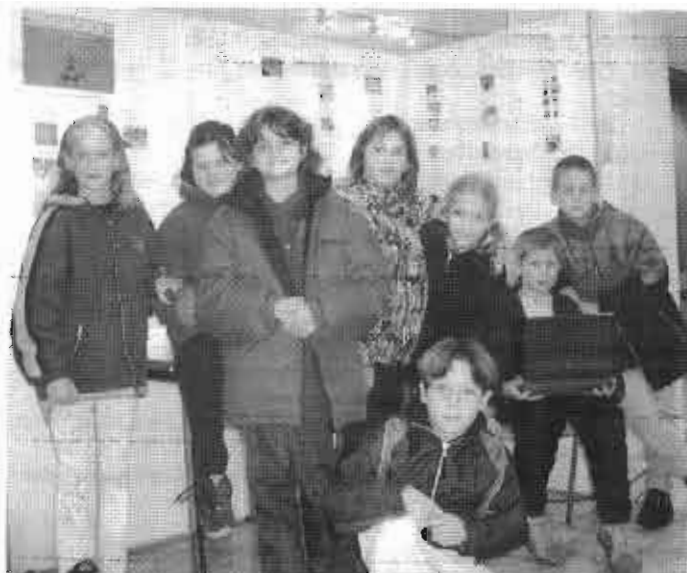
Im Landratsamt Göppingen präsentierten die Viertklässler ihre Wettbewerbsarbeit