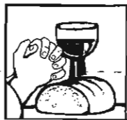
Der Dank veredelt Gottes Gaben.

Wir möchten Sie, Ihre Kinder und alle Angehörigen ganz herzlich zu den Erntedank-Gottesdiensten einladen! Freuen Sie sich an den wunderschön geschmückten Altären und erleben Sie bewusst - mit Freude und Dankbarkeit - die Fülle Gottes reicher Gaben!