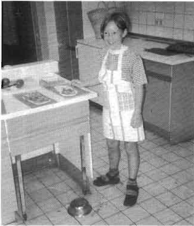
entweder Boden oder Pizza - aber nicht beides.

Wer fleißige Bäcker sehen will, muss nach Auendorf ins Backhaus gehen.