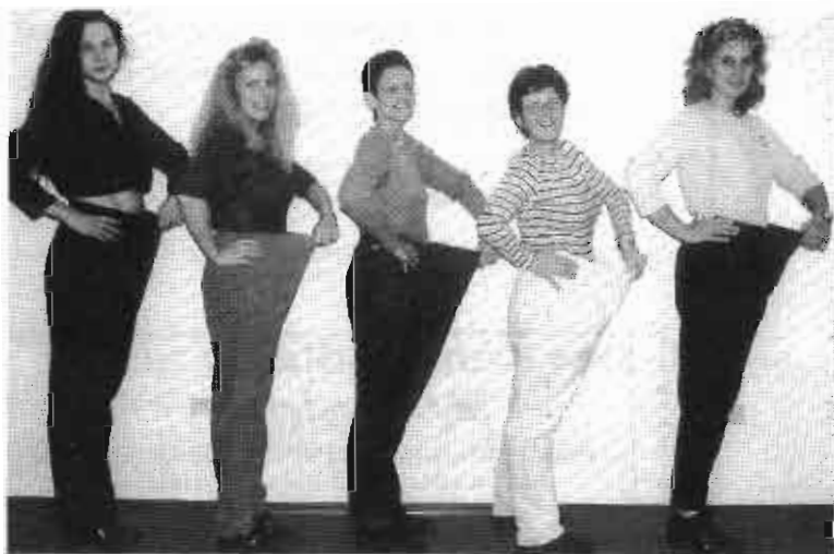
Tolle Abnahme bei Treffpunkt Wunschgewicht in Göppingen:

Wegen des großen Erfolgs in Göppingen – Jetzt auch in Süßen und Geislingen