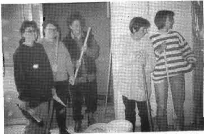
Das Auskehren der Baustelle übernahmen einige Kindergartenmütter. Dabei ging's ordentlich staubig, aber auch recht lustig zu.