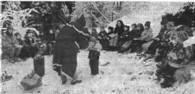
"Draußen vom Wald, da komm' ich her" Der Nikolaus kam zu den Kindergartenkindern

Bei unserer stimmungsvollen Waldnikolausfeier hatten wir Besuch von der Geislinger Zeitung, die den anschließenden Artikel schrieb: