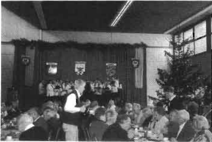
Gemischter Chor Auendorf

Insgesamt ein schöner und harmonischer Nachmittag, in dem deutlich wurde, dass Jüngere und Ältere in der Gemeinschaft ihren Platz haben und dass man in einer kleineren Gemeinde noch einen guten Zusammenhalt und eine Wertschätzung unter den Generationen erleben kann.