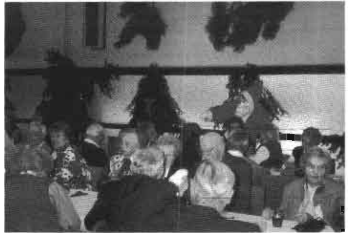
Der Nikolaus in Aktion!