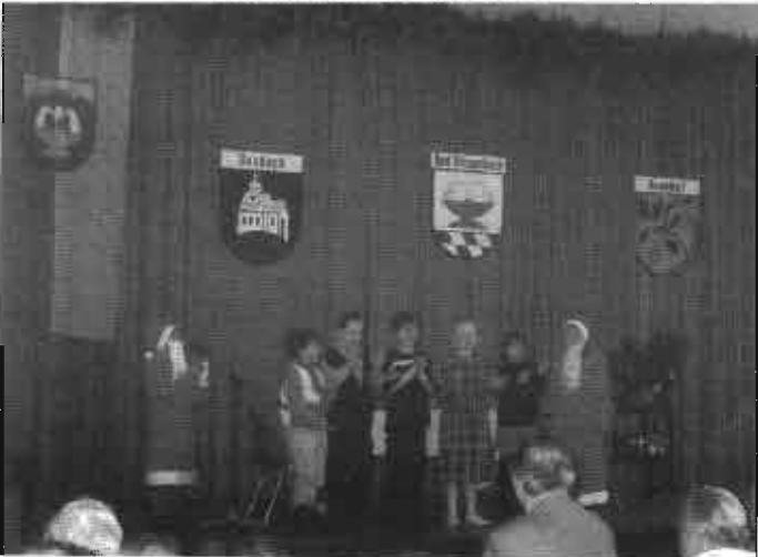
Schulklasse 3a der Grundschule Bad Ditzenbach "Der doppelte Nikolaus"