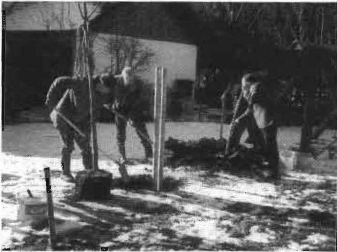
bei der Pflanzung