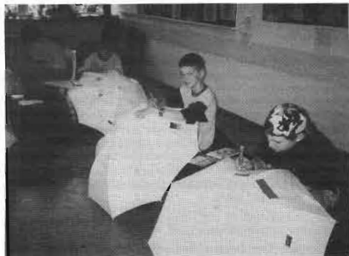
Vorbereitungen zum Auendorfer Festumzug: Sonnenschirme!

Die Vorbereitungen gehen ihrem Ende entgegen. Nun freuen wir uns auf einen sonnigen Festumzug am Sonntag, dem 18.07.1999.