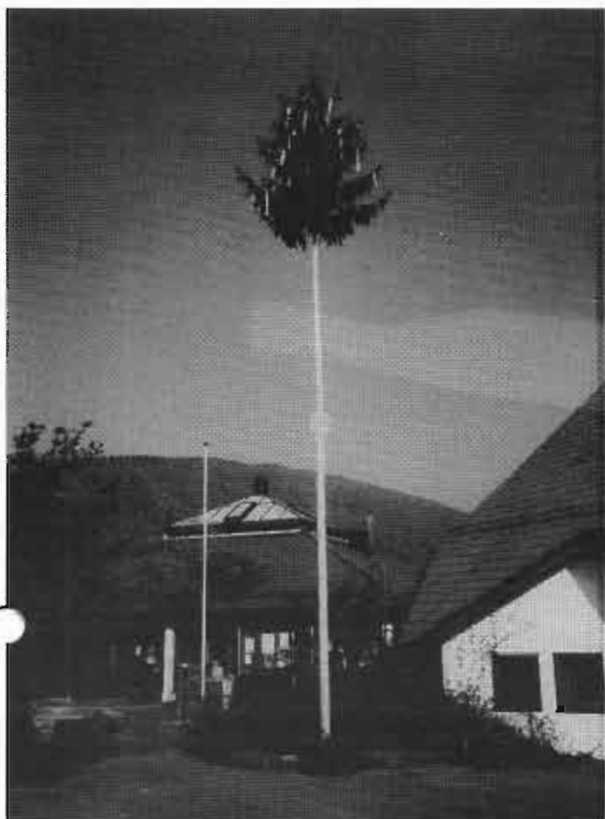
Maibaum am Feuerwehrhaus Bad Ditzenbach von der Freiwilligen Feuerwehr B.D.