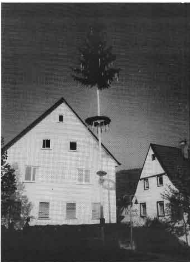
Maibaum am Rathaus Bad Ditzenbach vom Jugendraum und Schwäb. Albverein Bad Ditzenbach