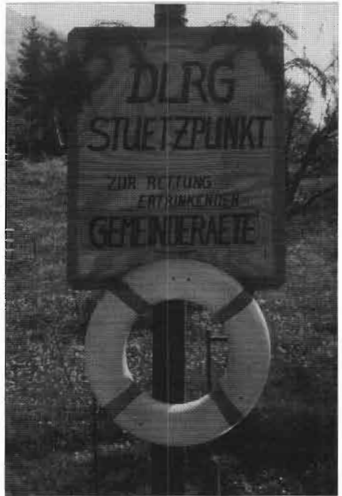
am Friedhof Bad Ditzgenbach