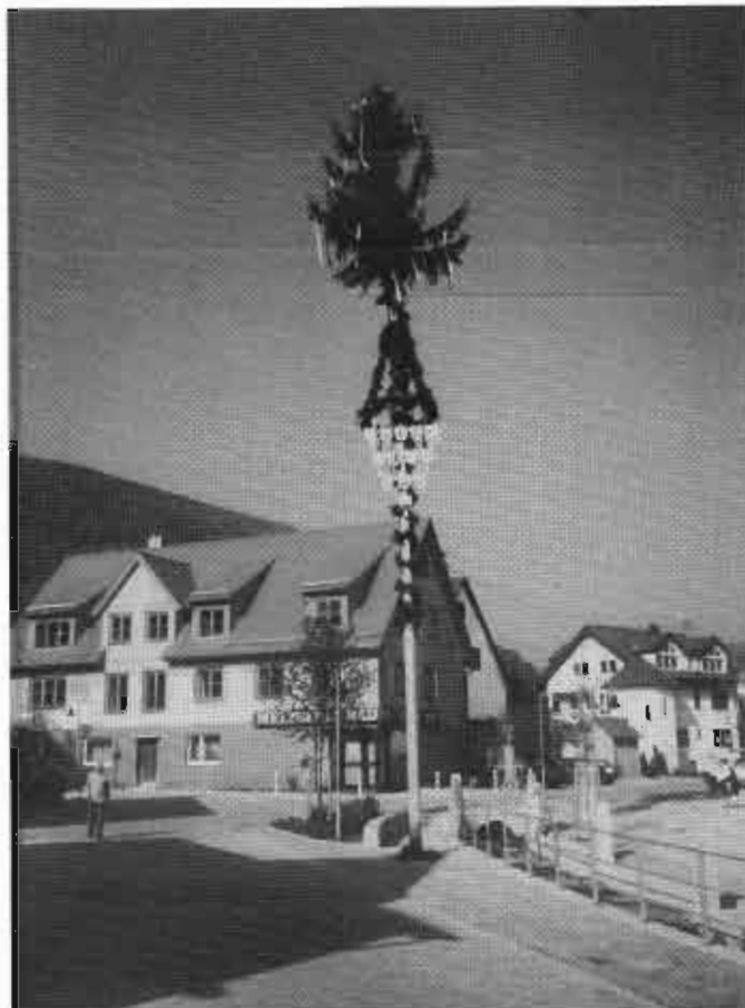
Maibaum in der Ortsmitte Gosbach von „de Oihomische“ Gosbach