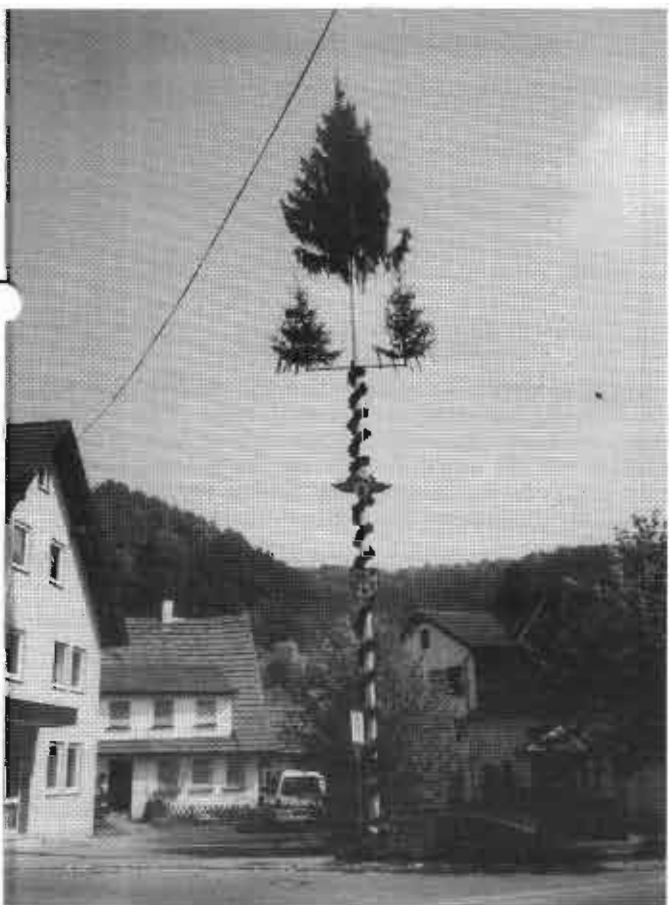
Maibaum in der Ortsmitte Auendorf von der Freiwilligen Feuerwehr Löschzug Auendorf