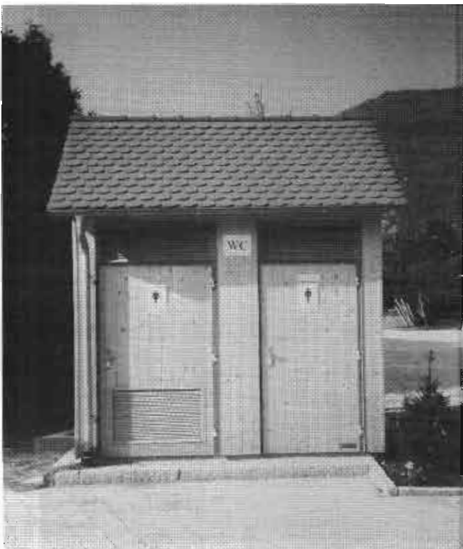
in der Ortsmitte Gosbach