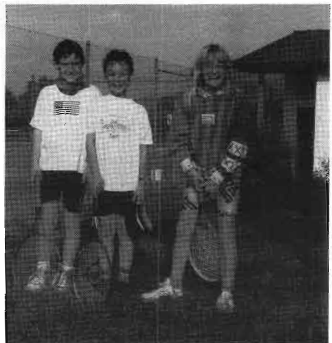
Unsere jüngsten Teilnehmerinnen