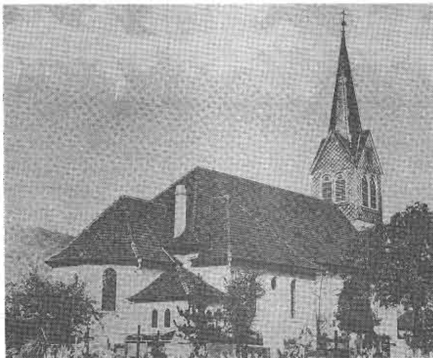
Außenansicht der Pfarrkirche in Gosbach