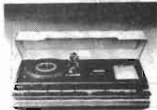
SABA ULTRA HiFi-Center 9940 electronic